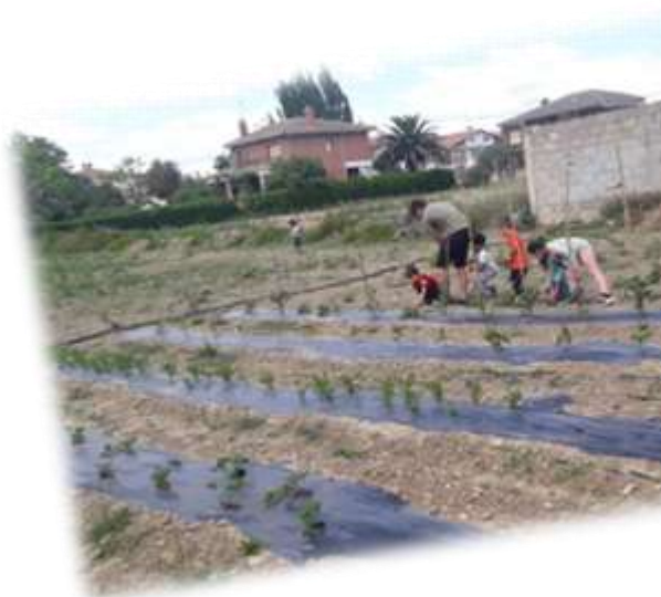
PREPARANDO LAS ALUBIAS