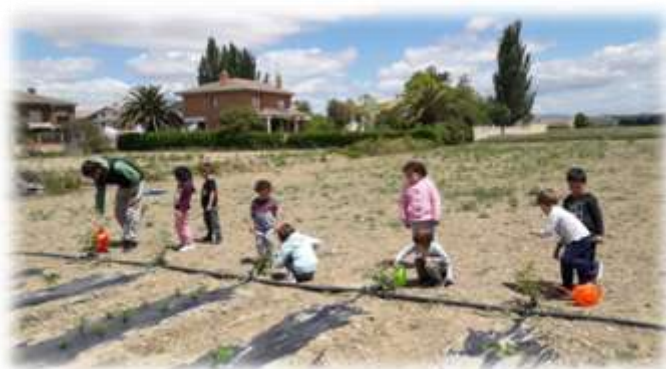
GRUPO DE INFANTIL REGANDO