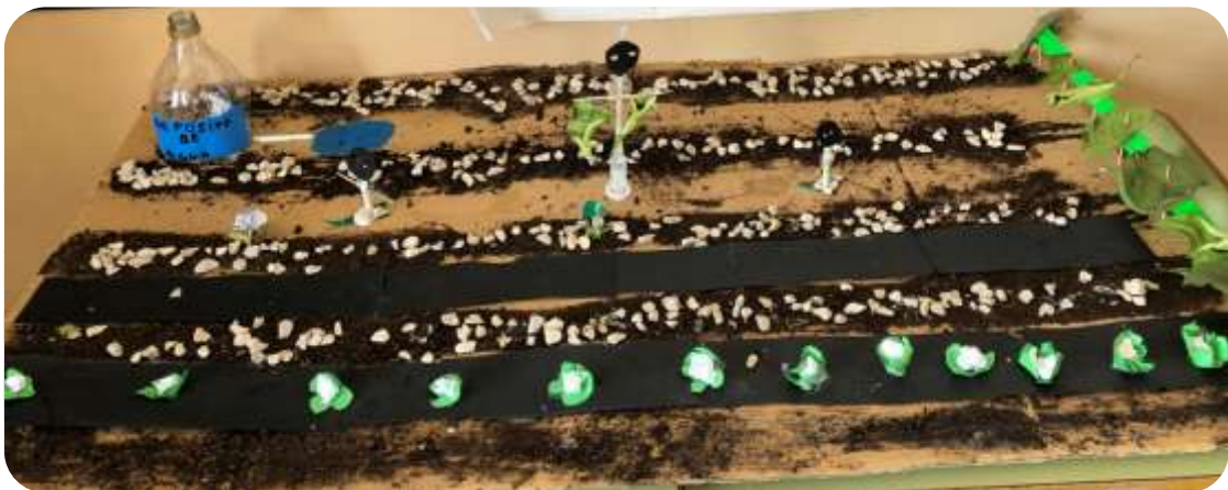
Maqueta del Huerto ecológico realizado por el alumnado de 2º y 3º de Primaria